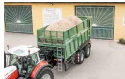
TA 23063 PP+ a un poids total de 20 500 à 24 000 kg.