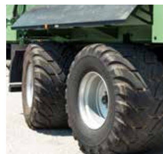
Essieu directionnel suiveur