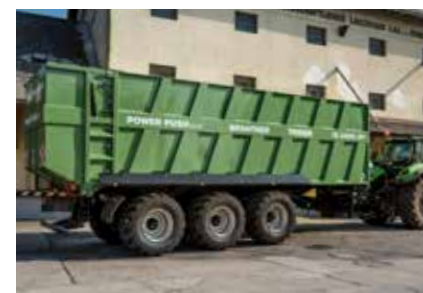
TR 34090 PP+ est équipé d'un châssis Tridem, avec un poids total de 34 tonnes et un volume de chargement de 43 ou 49 m³