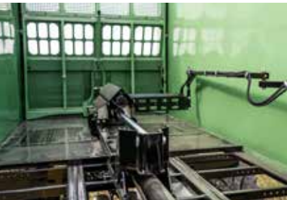
Fond divisé Le fond poussant et la paroi de déchargement reposent sur des plaques en plastique à faible usure, empilées l'une sur l'autre.