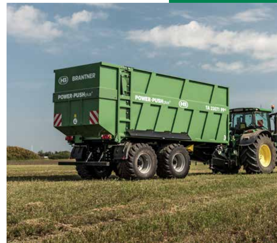
Le TA 23071 PP+ est disponible en option avec une barre anti-encastrement rabattable hydraulique.