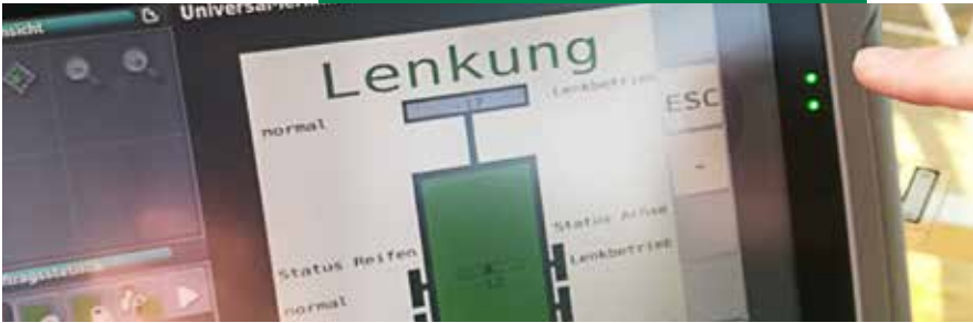
Terminal interface utilisateur fonctionnelle

La connexion s'effectue avec la même simplicité que l'utilisation ultérieure : seul le connecteur ISOBUS et trois conduites hydrauliques (LS) sont requis. Cela permet un contrôle centralisé de toutes les options supplémentaires sélectionnées via un terminal, éliminant ainsi le besoin de dispositifs de commande additionnels.