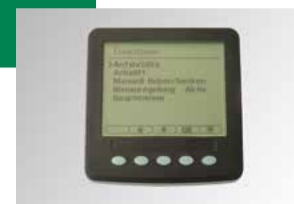
HP Premium Commande de l'essieu relevable, aide au démarrage, etc.