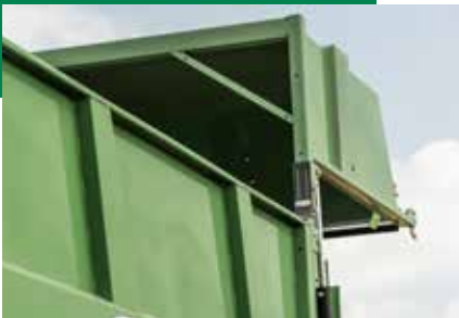
Porte arrière Volume de chargement supplémentaire grâce à la porte arrière profonde