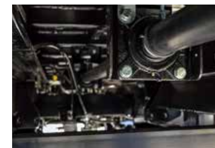
Prise de force Prise de force traversante pour le montage d'un mécanisme d'épandage ou d'une vis de transbordement.