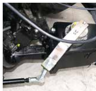
Direction forcée électrique