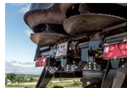
Support pour fourches à palette Montage facile avec chariot élévateur/téléchargeur télescopique.