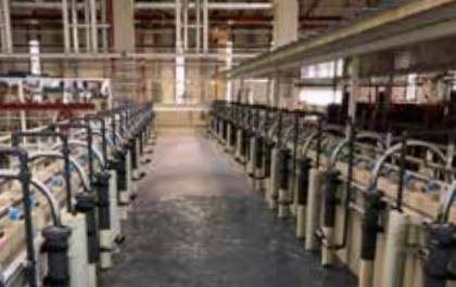
KTL & Prétraitement 12 cycles de trempage pour le nettoyage chimique et suivis d'un revêtement KTL.