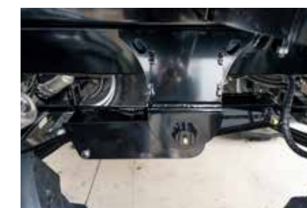
Groupe tandem décalé avec suspension adaptée à l'essieu directionnel, offrant une meilleure stabilité et une réduction de l'inclinaison.