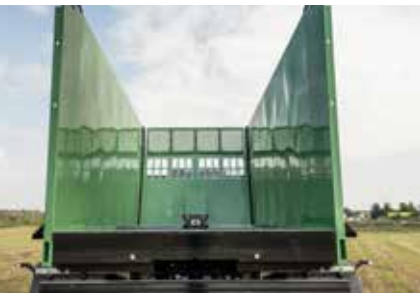
Aucune tige de tension n'est nécessaire grâce à l'énorme stabilité de la structure.