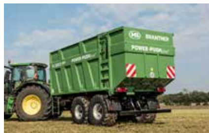
TA 20055 PP+ est équipé de parois latérales de 2000 mm en série.