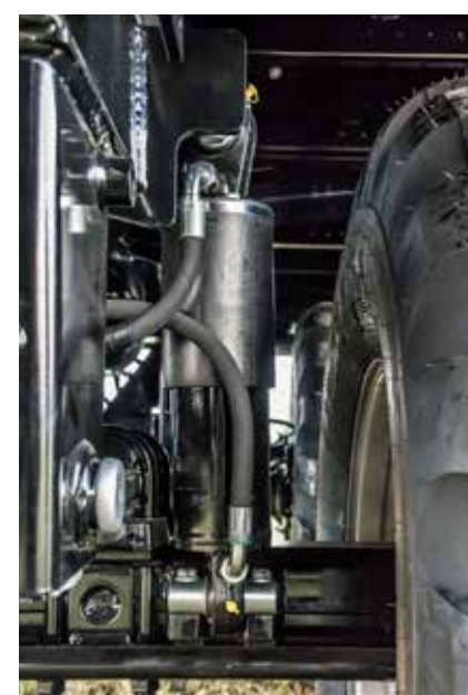
Suspension hydraulique pour une stabilité maximale dans les virages et les pentes.