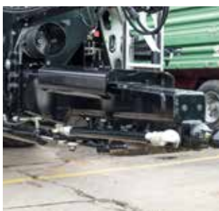
Direction forcée hydraulique - mécanique