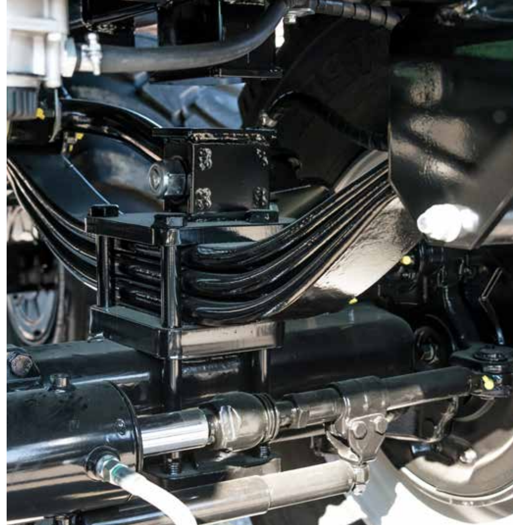
Groupe de suspension de 32 tonnes avec bascule d'équilibrage renforcée.

Le modèle haut de gamme absolu dans le segment professionnel.