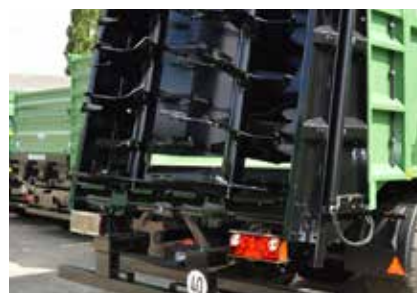
Système de distribution avec deux fraises verticales haute performance, dents de fraisage renforcées vissées en acier Hardox/Quard.