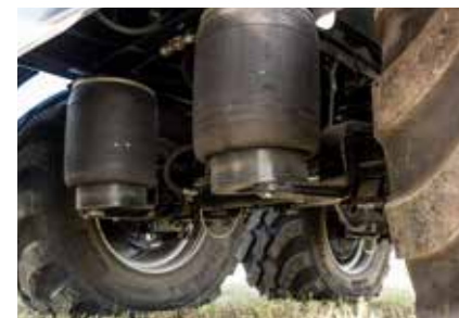
Suspension avec différents systèmes possibles, par exemple suspension à air ou suspension hydraulique.