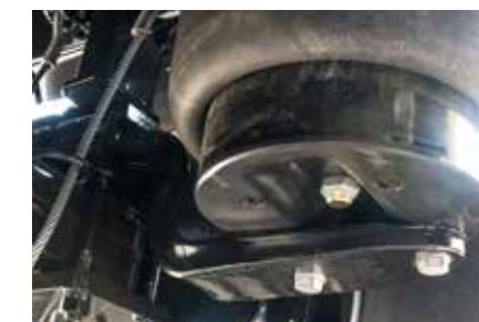
Suspension pneumatique avec bras à deux lames pour une stabilité et une aptitude au tout-terrain optimales.