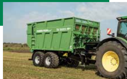
TA 16055 PP+ avec un volume de chargement de 20 à 26 m³.