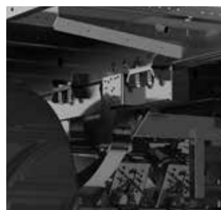
Cadre d'essieu vissé plusieurs fois