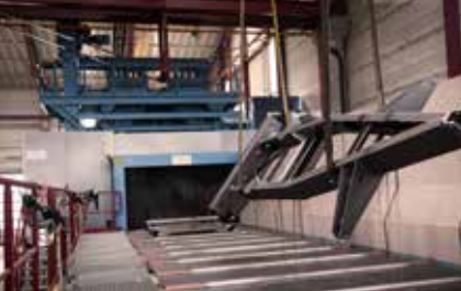
Sablage Prétraitement mécanique pour des surfaces propres et homogènes