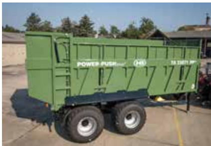
Rehausse latérale escamotable hydrauliquement.