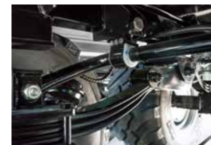
Stabilisateur de ressort, fortement recommandé pour les essieux directionnels (uniquement possible avec suspension à ressorts paraboliques).