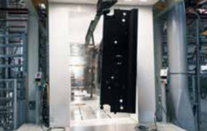
Poudre Revêtement en poudre automatisé