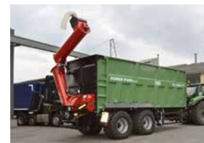
Vis de transbordement repliable hydrauliquement, avec vis sans fin transversale.