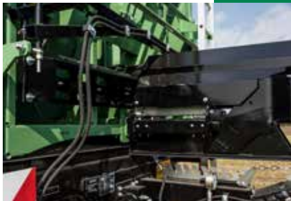
Cylindre de poussée Stockage devant la benne, pas de perte d'espace de chargement.